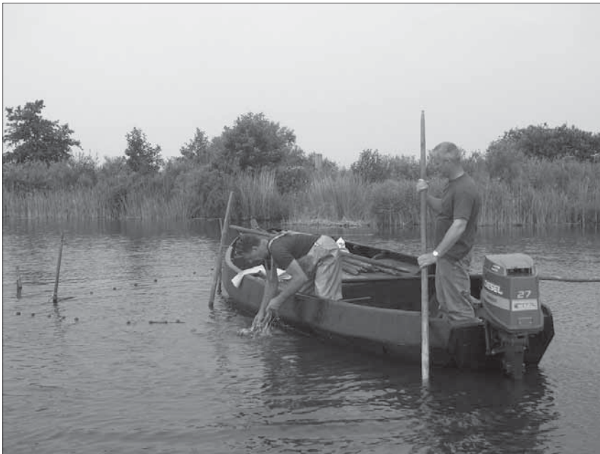
Membres de l'Association des professionnels de la pêche intérieure des Pays-Bas à la pêche aux anguilles. Ils sont disposés à relever le défi de la gestion de leurs pêcheries.

enfin sur quelque chose qui fonctionne convenablement.