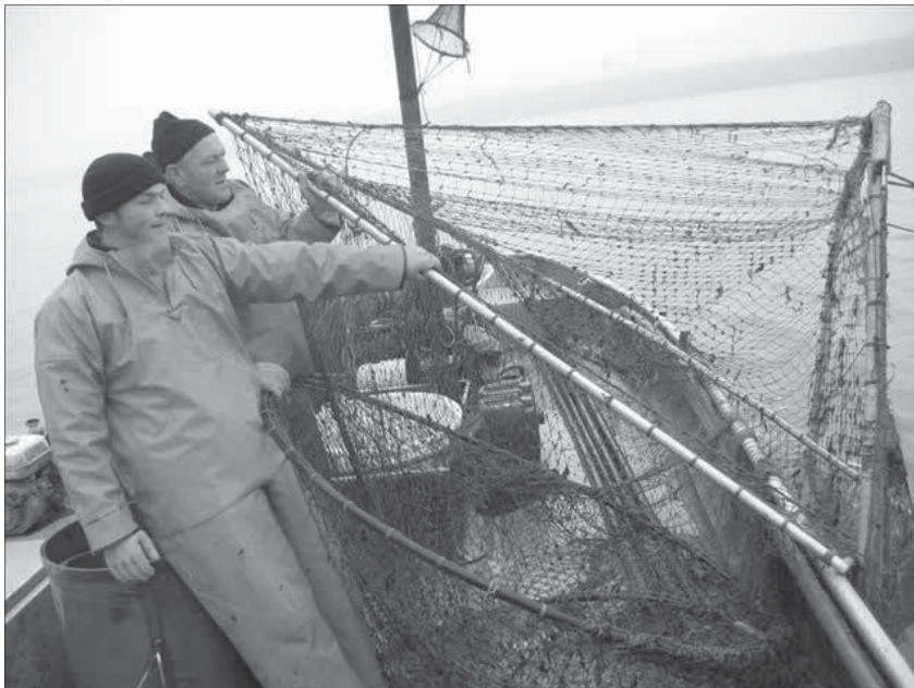
Pêcheurs sur le Rhin remontant un grand verveux utilisé pour capturer le saumon. Le système des lots incitait les pêcheurs à optimiser la productivité de leur pêcherie.