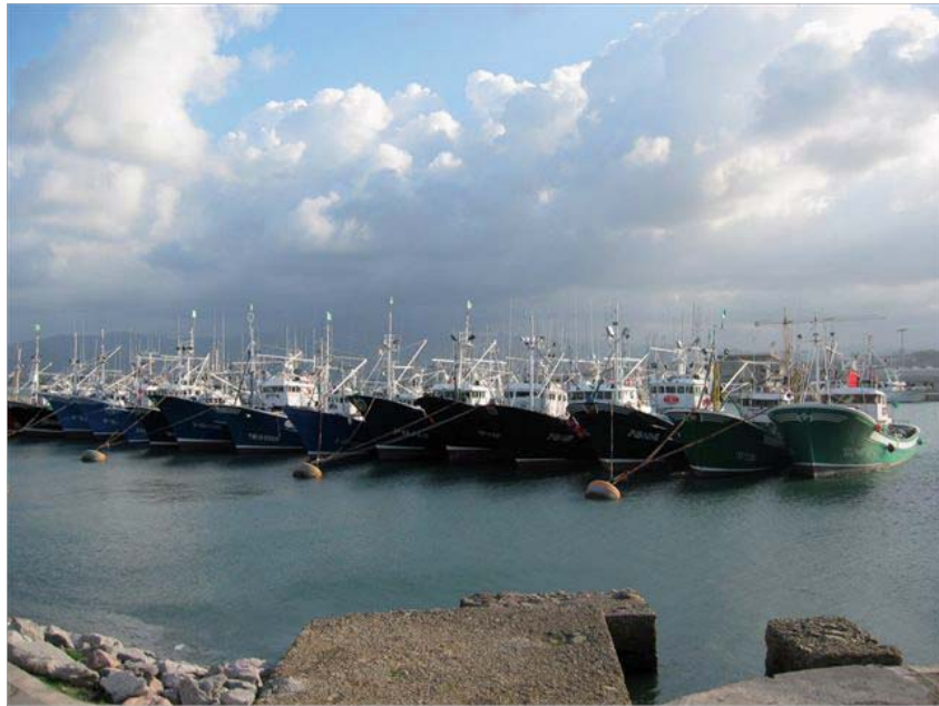
Flottille de canneurs dans le port de Hondarribia, Pays Basque, Espagne. Leurs intérêts sont défendus par des groupements d'armateurs

Compte tenu des nouvelles conditions économiques générées par la mondialisation des marchés et de l'importance du processus de révision de la Politique commune de la pêche de l'Union européenne qui est en cours, la plupart des armateurs choisissent de ne pas s'engager collectivement à commercialiser leur production via les cofradias . Et il se trouve qu'avec les nouvelles lois autonomes qui les régulent (Loi sur les pêches maritimes, par exemple), celles-ci peuvent désormais intervenir directement et en toute légalité dans la commercialisation des captures de leurs membres. Cela entraîne une augmentation exponentielle du capital investi par les négociants dans tous les aspects du circuit de production, et un renforcement concomitant de ce