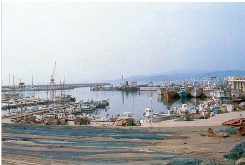
Le port de Palamos. Les cofradias espagnoles sont chargées d'organiser les activités de pêche dans leur circonscription