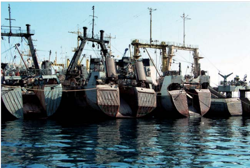
Dans le port de Las Palmas, îles Canaries, Espagne. Les États du pavillon devront établir des certificats attestant de la légalité des produits exportés dans l'UE