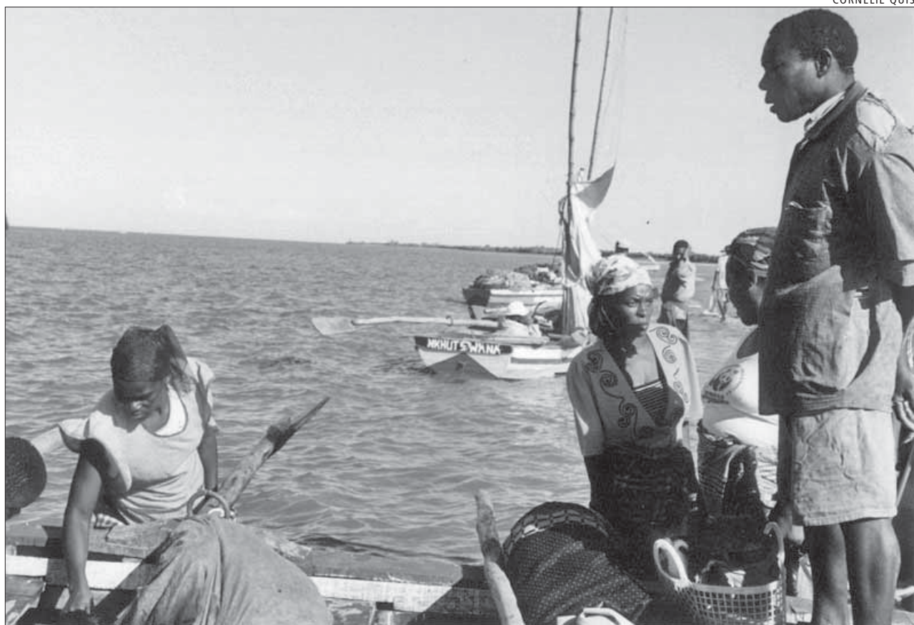
Pescadores mozambiqueños. La aplicación de AMP aporta en la práctica escasos beneficios para las comunidades pesqueras