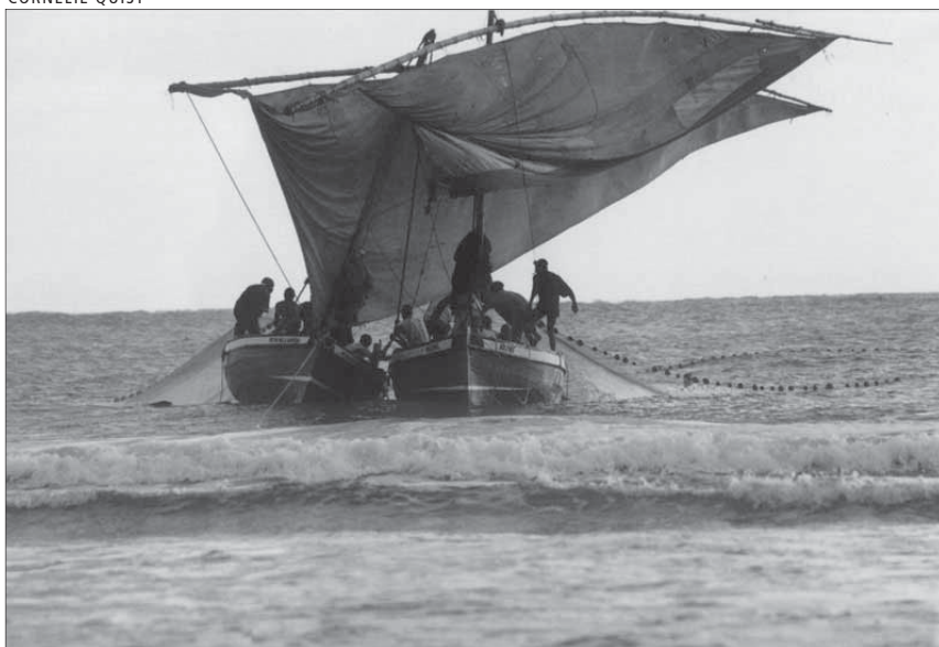
Pesca en pareja en la costa de la Península de Barral, en Mozambique. Los pescadores locales deben ser indemnizados por la pérdida de sus derechos en las AMP