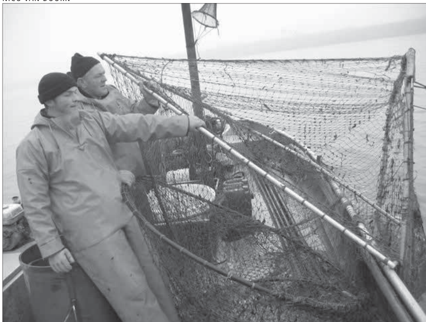
Pescadores en el Rin jalando un garlito empleado para la captura del salmón. El sistema de cotos de pesca permitió a los pescadores holandeses una mejor gestión de sus pesquerías