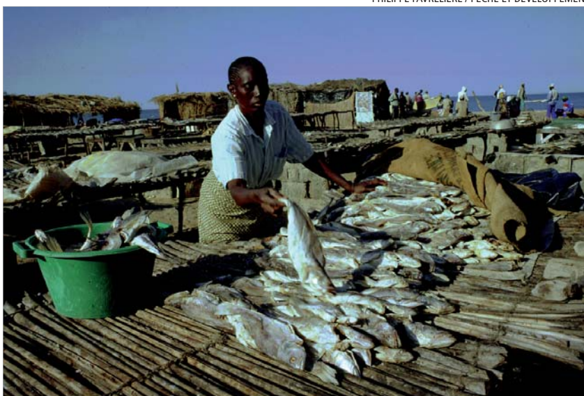
Poniendo el pescado a secar en Kkafountine, Senegal. El número de pescadores se ha duplicado en pocos años y el volumen de capturas mengua